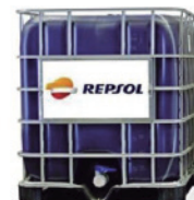
TOTE DE 1000 LTS.